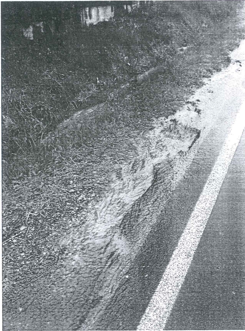
Skoczów ul. Wiślicka