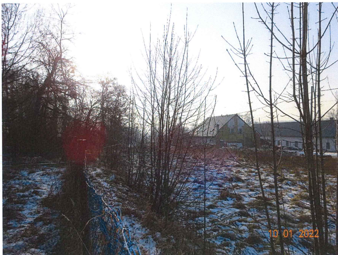
Zdjęcie nr 2 – działka nr 215/25 (większa)