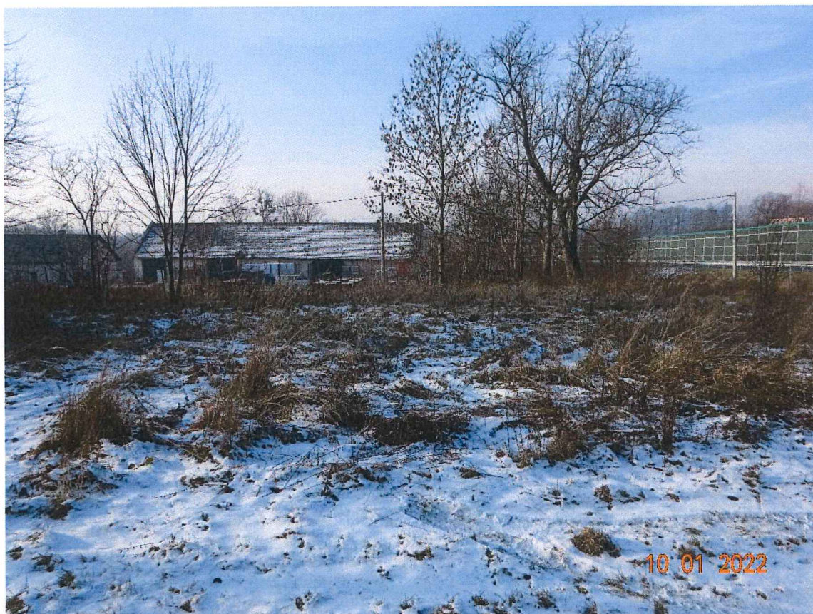
Zdjęcie nr 1 – działka nr 215/24 (mniejsza)