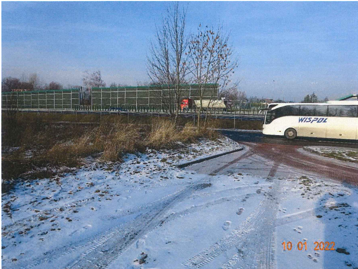
Zdjęcie nr 3 – zjazd na ulicę Cieszyńską