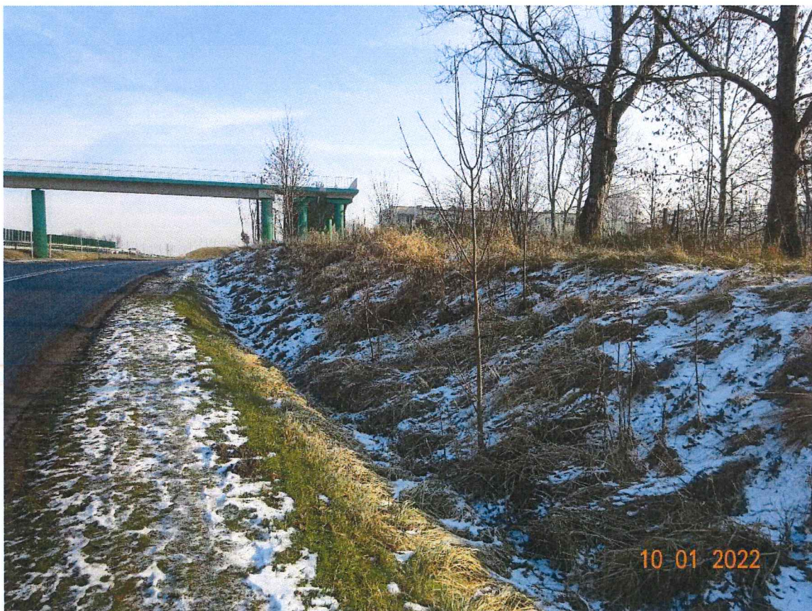
Zdjęcie nr 4 – widok od ul. Cieszyńskiej (granica działki biegnie górą skarpy)