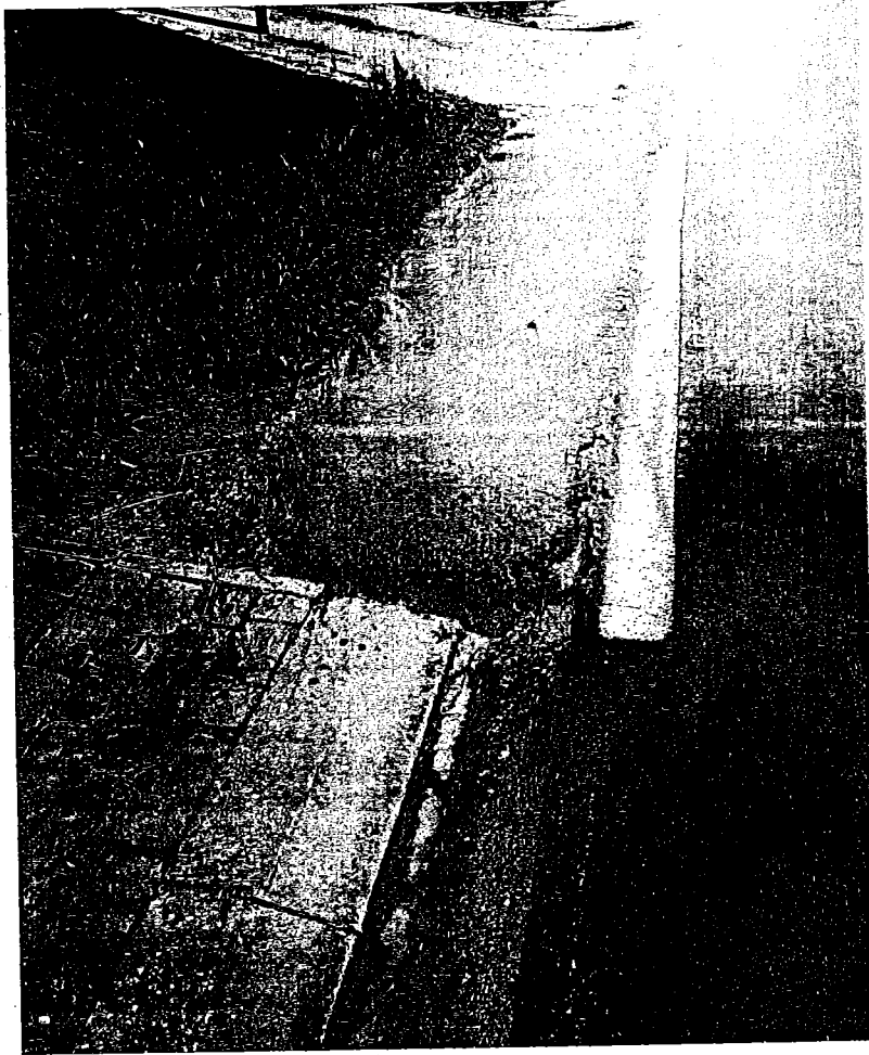
Skoczów ul. Wiślicka