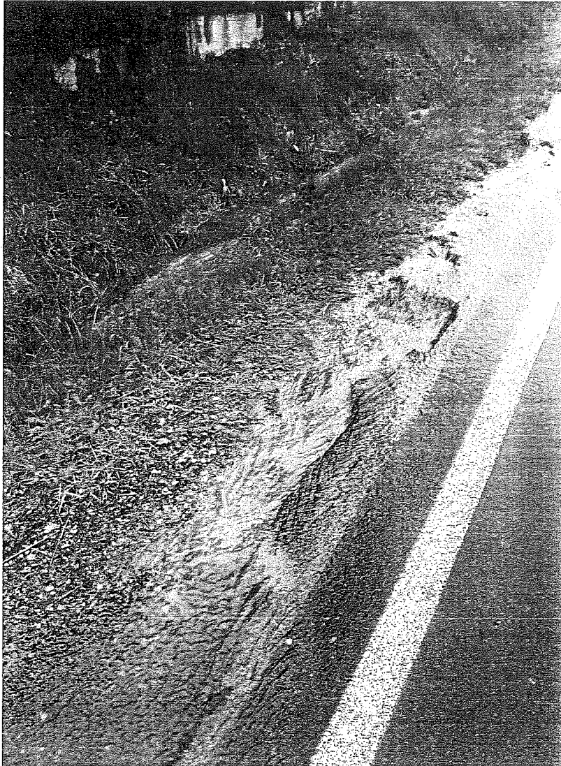
Skoczów ul. Wiślicka