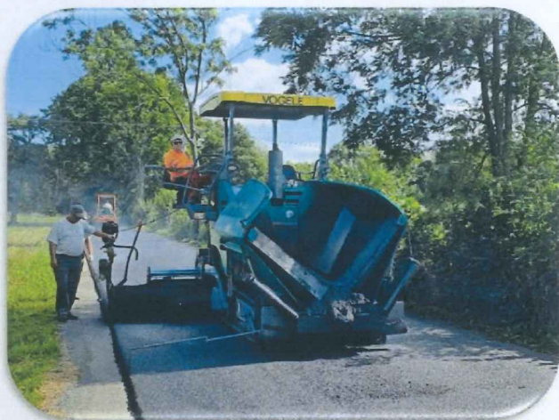
fol. – ul. Gołyska – remont cząstkowy odcinka nawierzchni w technologii masy asfaltobetonowej