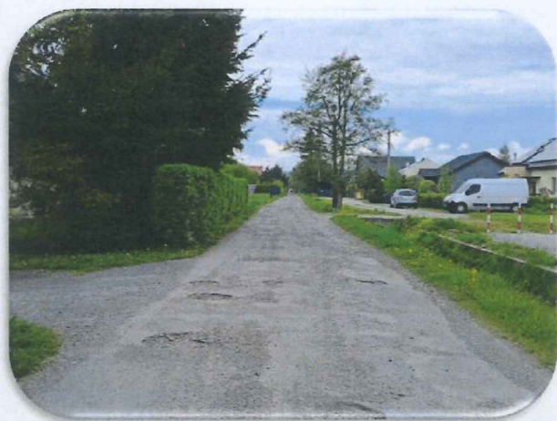
fot. – ul. Świetlicowa – remont częściowy odcinka nawierzchni w technologii masy asfaltobetonowej (przed i po remoncie)