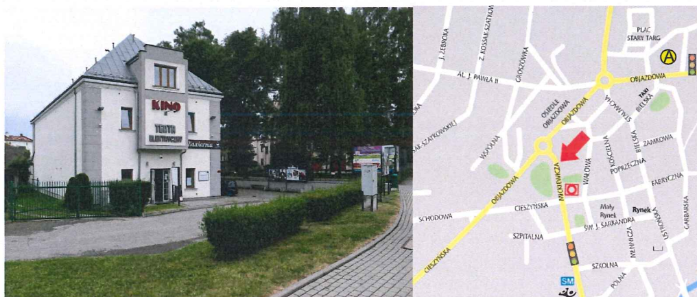
Zdjęcie fasady budynku Teatru Elektrycznego, lokalizacja graficzna.

3. Kameralne koncerty, recitale, gale wręczenia nagród, spektakle teatralne, baletowe, pokazy prelekcje, konferencje, szkolenia i przede wszystkim seanse filmowe odbywają się w skoczowskim kinie – Teatrze Elektrycznym . Dużym zainteresowaniem cieszą się retransmisje m.in. spektakli, koncertów, oper, baletów oraz jedyne w regionie pokazy filmów z audiodeskrypcją dla osób niewidomych i słabo widzących. Kino jest też miejscem spotkań Dyskusyjnego Klubu Filmowego „Piekiełko”. Zabytkowy, wyremontowany i przebudowany obiekt pełni swą podstawową funkcję z krótką przerwą od 1912 r. Kino wyposażone jest w znakomity sprzęt techniczny, posiada doskonałą akustykę. Ponadto Teatr Elektryczny do 16 grudnia 2021 r. był objęty systemem sprzedaży internetowej biletów. Od tego czasu rezerwacji i zakupu biletów można dokonać poprzez portal Biletyna.pl. W kasie kina istnieje możliwość skorzystania z terminala płatniczego. Oprócz sali kinowej (104 miejsca), kasy, biura i kabiny projekcyjnej w budynku administrowanym przez MCK „Integrator” znajduje się na poddaszu „Kawiarnia 2 piętro” (całe poddasze jest wynajmowane).