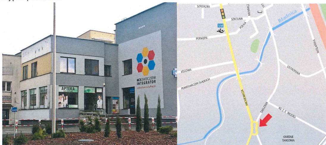
Zdjęcie wejścia do sali widowiskowej „Pod Pegazem”, lokalizacja graficzna.

2. Największa sala – sala widowiskowa „Pod Pegazem” – zlokalizowana jest przy ul. Targowej 26. Organizowane są tam m.in.: koncerty, recitale, przedstawienia teatralne, prelekcje, przeglądy, konkursy, spotkania, wieczorki taneczne. Podczas kinowego ustawienia krzesła sala mieści 248 os. Sala wynajmowana jest osobom fizycznym i prawnym na spotkania, prezentacje, konferencje, kiermasze itp. Korzystają z niej również skoczowskie organizacje przy okazji zebrań walnych, podsumowań rocznych (m.in. PTTK – koło Miejskie w Skoczowie, Skoczowski Uniwersytet III Wieku, Spółdzielnia Mieszkaniowa „Wspólnota”). W ciągu tygodnia odbywają się w niej warsztaty taneczne i teatralne oraz różnorodne zajęcia pozostałe.