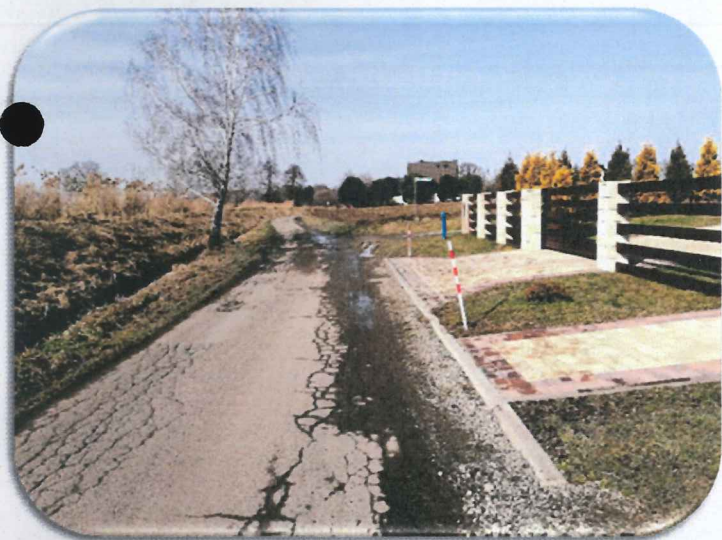
fot. – ul. Podbór w Ochabach przed i po remoncie nawierzchni.