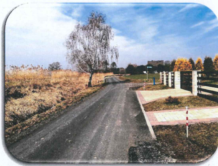
fot. – ul. Buczyna w Ochabach przed i po remoncie nawierzchni.