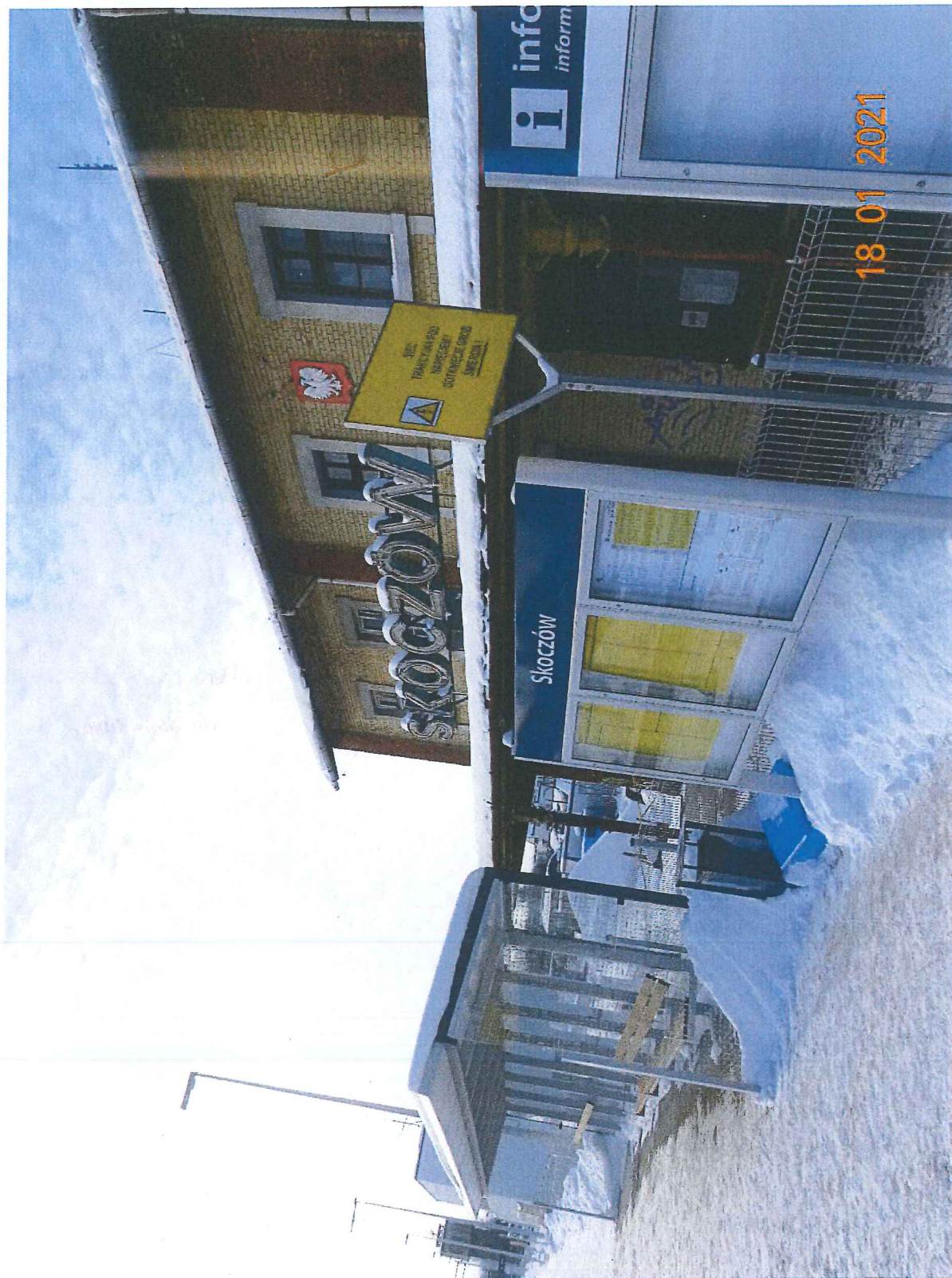
Zdjęcie nr 1 – napis „Skoczów” na starym budynku dworca PKP.